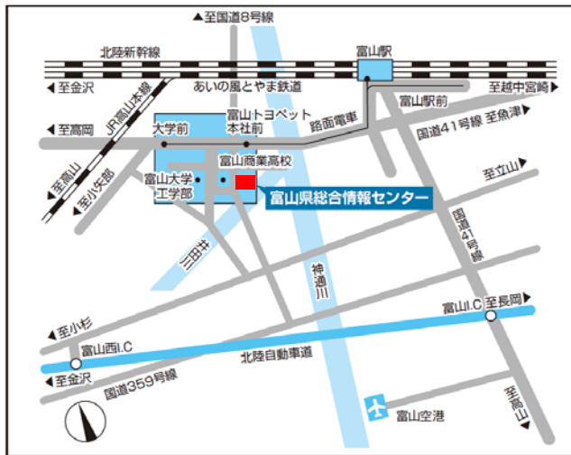
引用:富山県総合情報センター ホームページ